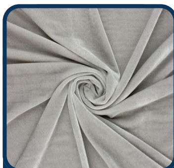
Gris - 10 1322410005