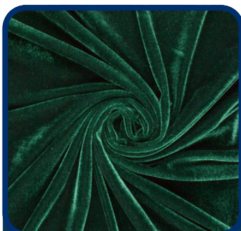
Vert Foncé - 11 1322410006