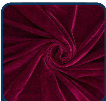
Bordeau - 5 1322410003