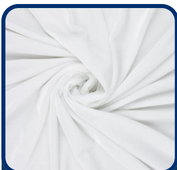
Blanc - 12 1322410007