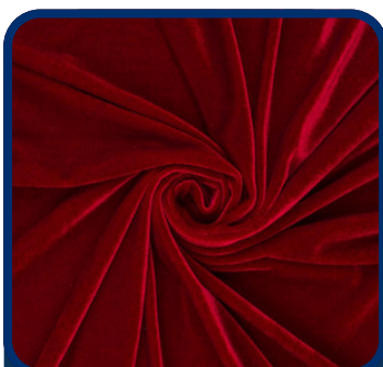
Rouge - 1 1322410001