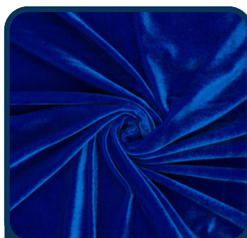
Bleu Roi - 14 1322410009