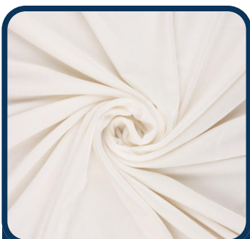
Ivoire - 13 1322410008